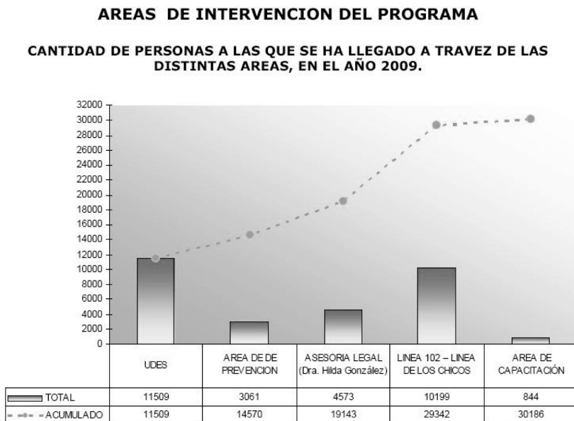
Figura. 1. Número total y acumulado de personas atendidas (niños/as y adultos) en las distintas áreas del Programa Provincial de Prevención y Atención del Maltrato a la Niñez, Adolescencia y Familia. Ley 6551. Año 2009

Nota: UDES hace referencia a las Unidades Departamentales Especializadas.