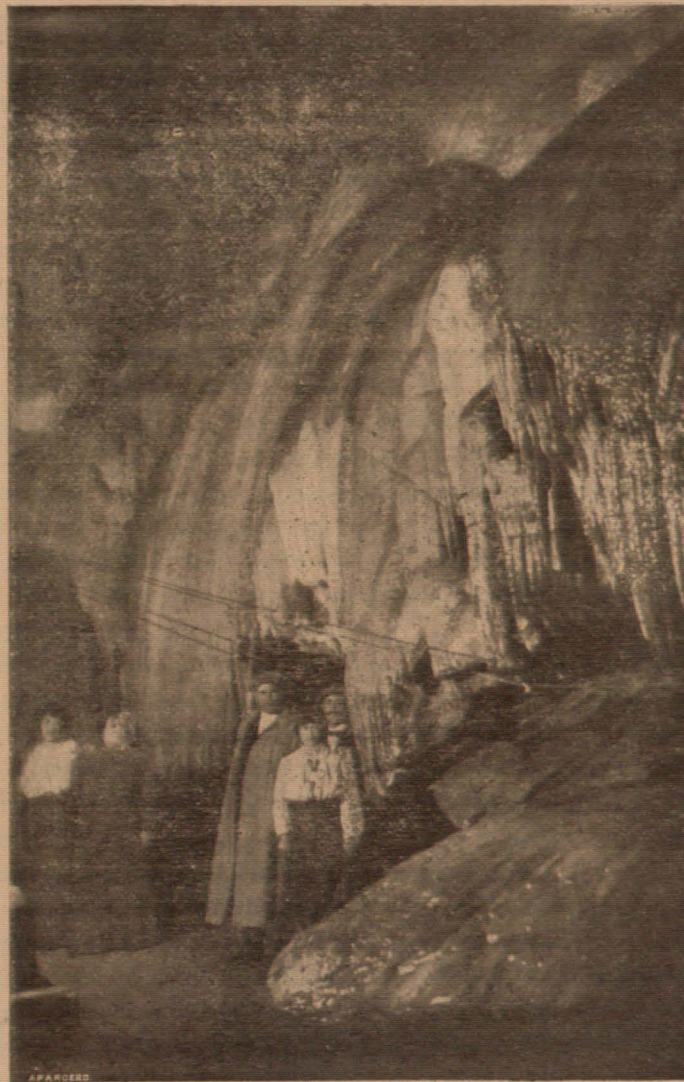
El "Salón de los brillantes" en la Gruta de las Maravillas

de pensar. Y entretanto, compadezcamos a los pobres pueblos cuyas viviendas tienen bajos los techos. ¡Qué dolor de pueblos los de pensamientos deprimidos y de conciencias estrechas! ¡Qué tristeza de hombres, los de cerebros romos, aplastados por la influencia de un techo puesto