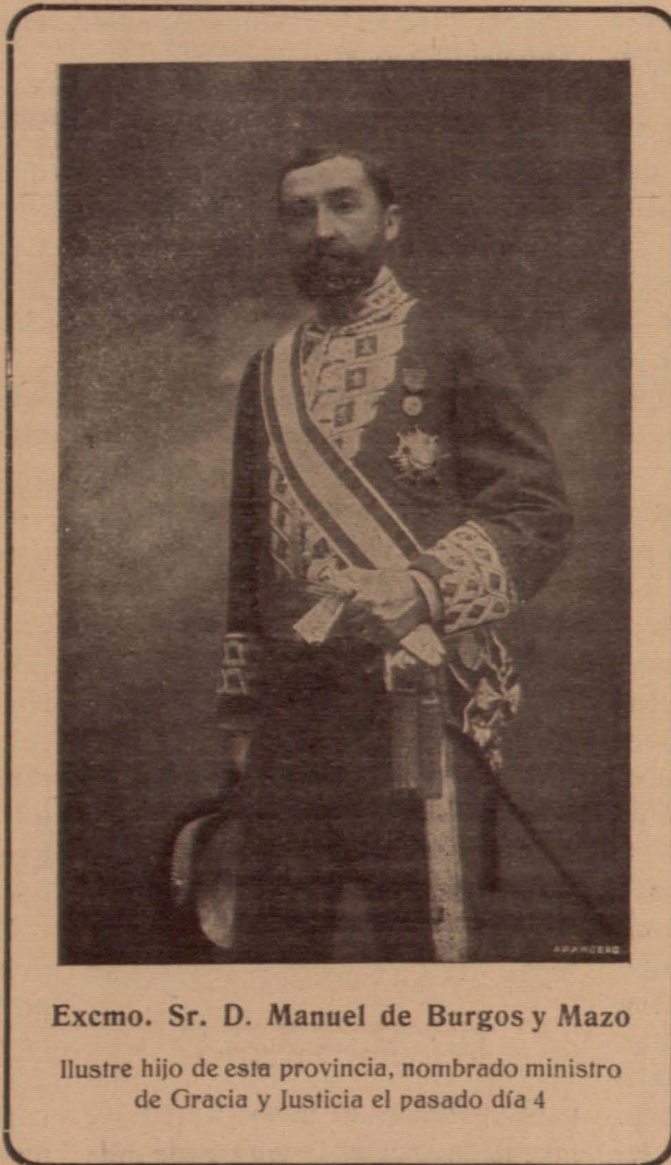
Excmo. Sr. D. Manuel de Burgos y Mazo

Era ministrable hace mucho tiempo, teniendo para ocupar dicho puesto más preparación que muchos de los