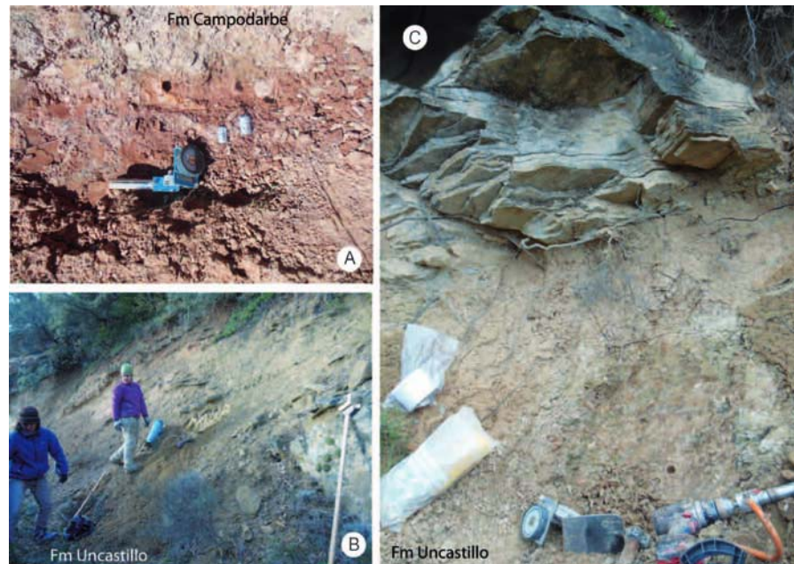
Fig. 2.- A) Zona de muestreo en la Fm Campodarbe de la sección de Luesia. B y C) Afloramiento de la Fm Uncastillo en la sección de Fuencalderas. Figura en color en la web.

La medida de la anisotropía de la susceptibilidad magnética se ha realizado en el Laboratorio de Paleomagnetismo CCITUB-CSIC con un KLY-2, y en el Laboratorio de la Universidad de Zaragoza con un KLY-3 (AGICO Inc.). El procesado de datos se ha realizado con el programa Anisoft 4.2 siguiendo los parámetros de Jelinek (1981). La susceptibilidad magnética ( k_m ) se representa por medio de un tensor de segundo orden que tiene su expresión geométrica en el elipsoide magnético. Los parámetros de forma que definen el elipsoide magnético son la lineación magnética ( L = k_{max}/k_{int} ), la foliación magnética ( F = k_{int}/k_{min} ), el grado de anisotropía corregido ( P' ), que indica la intensidad de la orientación preferente de minerales y el parámetro de forma T , donde las formas prolatas tienen valores -1 < T < 0 y las formas oblatas son 1 > T > 0 . Además,