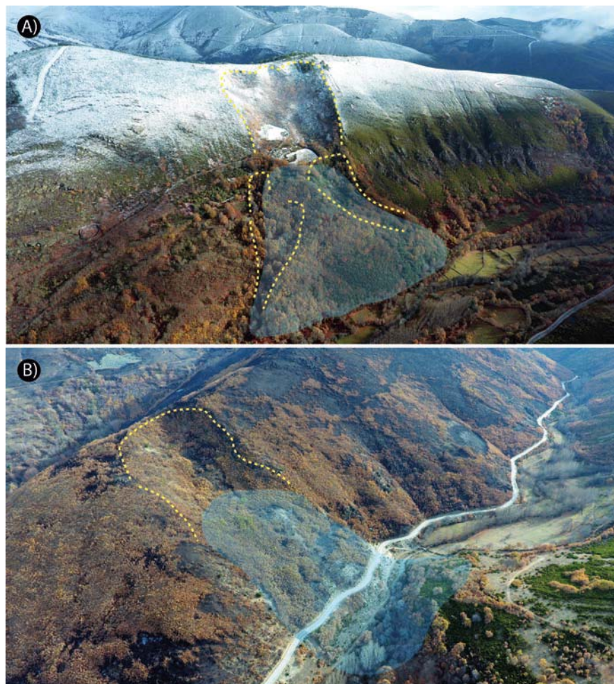
Fig. 2.- Imágenes aéreas oblicuas de los movimientos en masa de: A) Tejedo de Ancares y B) Silván (La Cabrera). Las líneas discontinuas marcan la posición del escarpe de rotura. En transparencia la masa desplazada. Ver figura en color en la web.

representada por un escarpe o cicatriz de rotura neta en ambos movimientos, no observándose en ninguno de los dos casos grietas de tracción en cabecera. La morfología de la superficie de rotura es circular y cóncava, aflorando el macizo rocoso sin alterar. También se observan depresiones semicirculares y estructuras canalizadas en zonas próximas a la cabecera, que se hacen evidentes en el caso de Silván. En este último ejemplo se observa la acumulación de la masa desplazada en la base del mismo, pero a diferencia de Ancares, parte del material se acumula en la vertiente opuesta (Fig. 2), socavando el río la masa desplazada y dejando al descubierto bloques de gran tamaño e independizados por el lavado de la matriz. Esta acumulación de material ha generado una diferencia topográfica aproximada de 20 m entre la cota relativa al paleocauce del río Silván (937 m) y la actual (955 m) (Fig. 3).