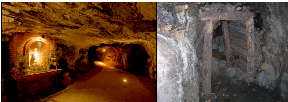
Figura 8: Minas de Almadén, fotos: María José Rubín, dondeviajamos.com y www.esmuñostorrero.juntaextremadura.es

“...he resuelto por punto y regla general, que en las diez leguas de su contorno, contadas desde las quatro que se consideran por boca de minas, cárcabas y torronteros, tenga el Superintendente jurisdicción privativa en razón de pastos para los bueyes destinados á sus trabajos, y también para el corte de las maderas y leña necesaria para sus labores: y que sobre la referida jurisdicción no se pueda formar competencia por los referidos Subdelegados y demás sugetos mencionados” 34 .