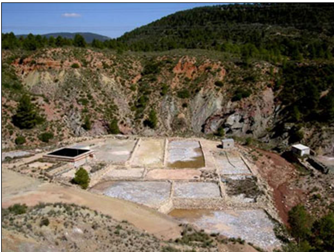
Figura 13: Salinas de San Javier, Cofrentes, Valencia.