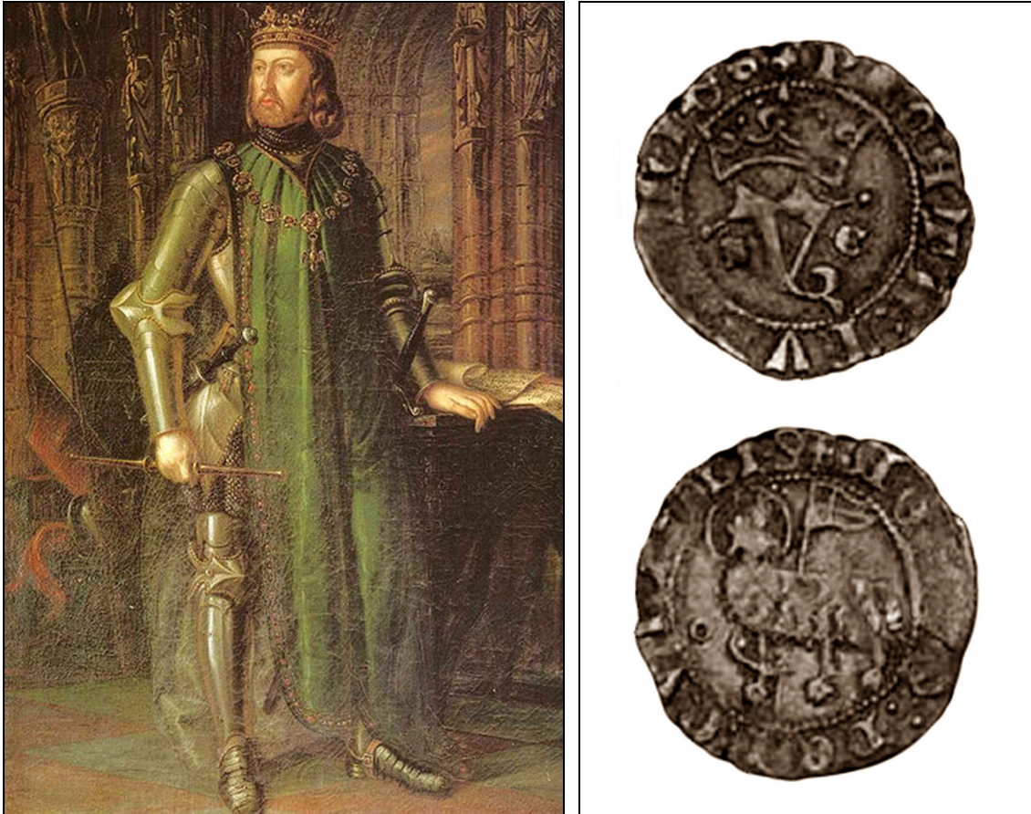
Figura 1: Juan I de Castilla fue rey de Castilla desde el 24 de agosto de 1379 hasta el 9 de octubre de 1390. Segundo rey de la dinastía de Trastámara, hijo de Enrique II el de las Mercedes y de Juana hija de Juan Manuel de Ville. Agnus Dei, moneda de la época.