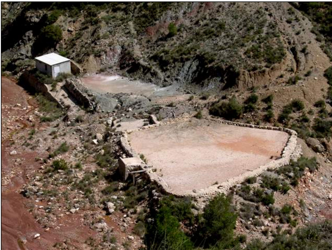
Figura 12: Salinas de San Javier, Cofrentes, Valencia.