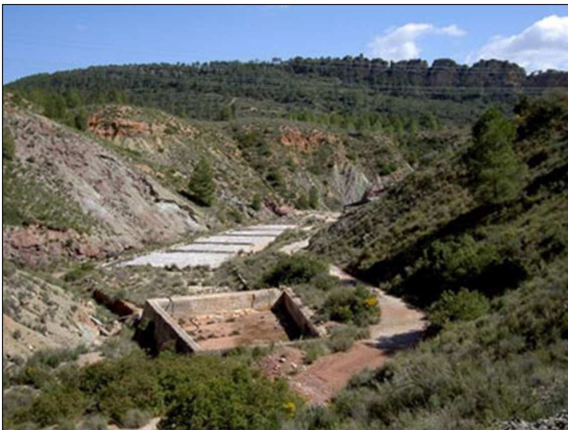
Figura 14: Salinas de San Javier, Cofrentes, Valencia.