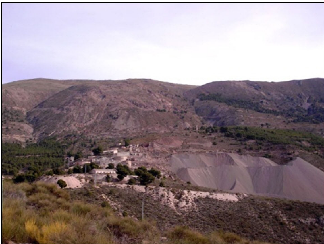
Figura 4: Lavaderos de mineral de Berja.

La Corona pretende descender hasta los casos más insignificantes, por ejemplo, advierte que nadie “para labrar y desmontar su mina” pueda echar en mina ajena la tierra que extrajese de la suya, la multa se estipula en diez ducados cada vez que lo hiciese, la Justicia de minas intervendrá obligando a sacar la tierra y limpiar la mina o pertenencia afectada, lo que se hará a cargo del infractor.