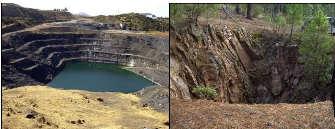
Figura 9: Minas de Almadén, fotos: El Día de Ciudad Real, Noticias de Historia Antigua y Arqueología y MTI-Minas Aragón, Pozo Pilarez , foto: J.M. Sanchís, 2008.

Así el Comisionado como el Subdelegado, en la comisión de la mina de azogue del Collado de la Plata en su caso, o el Superintendente de la mina tenían jurisdicción civil y criminal en causas y negocios tanto civiles como criminales de los empleados y operarios dependientes de la mina, como juez privativo de ellos y con inhibición de otros Tribunales, que no fuesen el de la Superintendencia General.