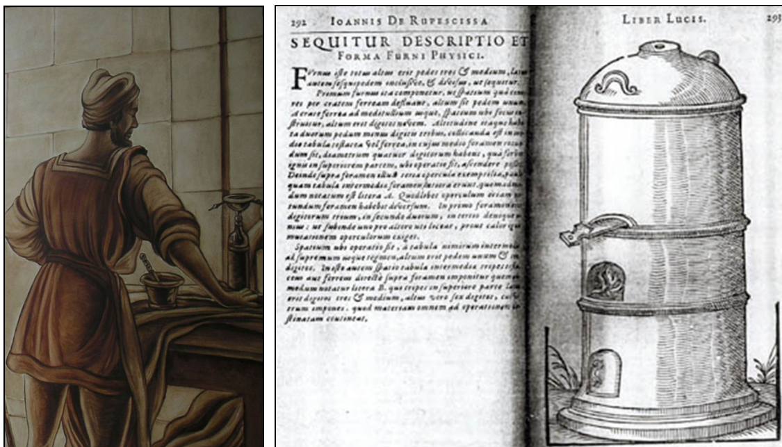
Figura 5: Mural de Arnao y grabado sobre alquimia, destilación y de ensayo de metales, Liber Lucis de Ioannis de Rupescissa.

Y cuando para fundir el metal de una mina convenga, para facilitar la fundición, echarle “ revoltura ” de metal de otra mina, se pueda hacer con licencia del administrador del partido, siempre que lo añadido no exceda la ley del metal a fundir. Si excede en ley queda prohibida esta fundición bajo pena de la pérdida del metal a fundir “ con otro tanto ”, la mitad para la Real Cámara y la otra mitad para el denunciante y para el juez que sentencie.