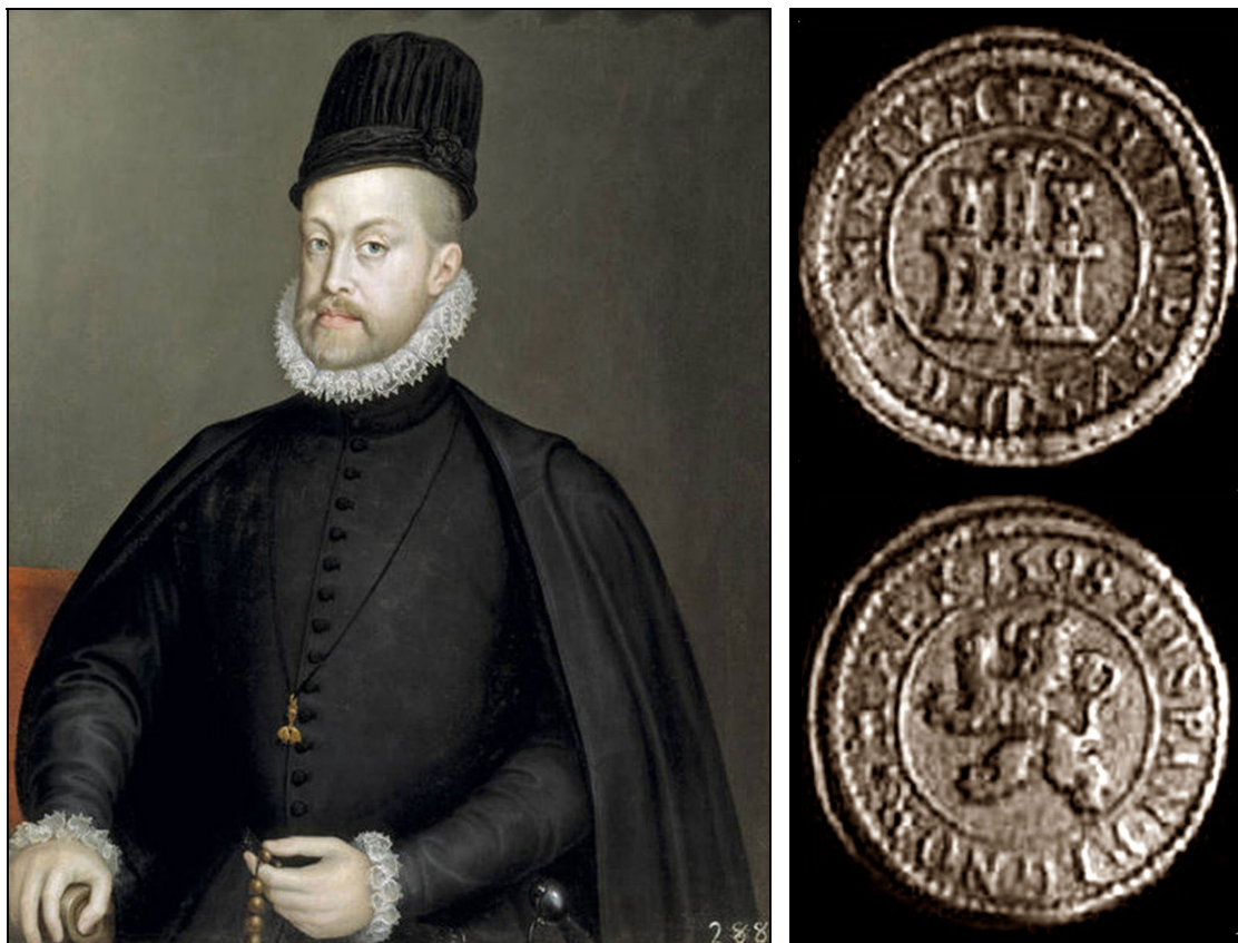
Figura 3: Vestido con su ropa habitual y un sombrero negro alto, con la Orden del Toisón de Oro en el pecho, rosario en mano izquierda, El retrato es de la época de su matrimonio con Isabel de Valois. Retrato de Sofonisba Anguissola, entre 1532-1625. Moneda: un maravedí, medida: 15 mm, año: 1598; anverso: PHILIPPVS D G OMNIVM, rodeando a un círculo con un castillo en medio; reverso: HISPAN REGNORUM REX .AÑO, rodeando a un círculo con un león a izquierda en medio.

El 22 de Agosto de 1584 se dictaron nuevas ordenanzas, que constituyeron la base de la Legislación minera pero que se volvieron a modificar en 1607 afectando a los impuestos del oro y la plata. El 15 de Mayo de 1624 y debido a las irregularidades en las cobranzas de los impuestos mineros, se creó por R.O. una Junta de Minas (1624-1643) para entender en asuntos de registro, laboreo y cobranzas de impuestos.