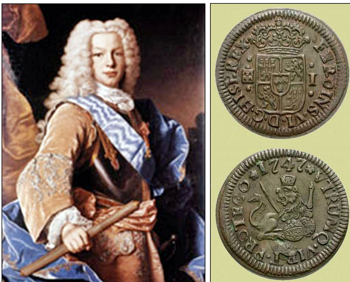
Figura 7: Fernando VI, 23-09-1713, Madrid. Moneda: 1 maravedí, ceca de Segovia, 15 mm, 1747; leyenda anverso: FERDINS VI D G HISP REX, rodeando a un escudo coronado cuartelado de castillos y leones, en el centro 3 flores de lis, entre ceca y valor I; reverso: VTRUMQ VIRT PROTEGO. AÑO, rodeando a un león coronado con espada, cetro y debajo 2 mundos.