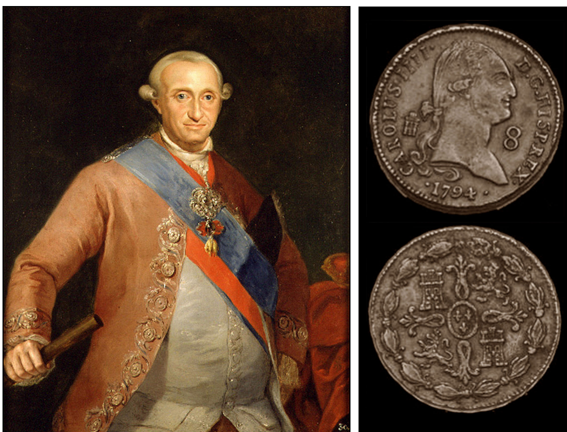
Figura 10: Carlos IV. Foto: Lauer, A. Robert «El siglo XVIII: El Siglo de los Reyes». Capítulo 9. Notas basadas en la 4 a . ed. de Civilización y cultura de España de Vicente Cantarino. Moneda: 8 maravedís, 30 mm, 1794, leyenda anverso: CAROLUS IIII D G HISP REX. AÑO, rodeando al busto del rey a derechas entre ceca y valor. Reverso: cruz de don Pelayo cantonada de castillos y leones, en el centro 3 flores de lis, todo rodeado por una corona de laurel.

Entre sus atribuciones estarían el cuidado de que cada uno cumpla con su obligación y castigar con severidad al que no se ajuste a la disciplina establecida. El comisionado y su sustituto, que en adelante sería superintendente de la mina, acataría en todo al superintendente general, debiendo informarle de todo lo que fuese digno de mención. En su jurisdicción estaría entender en aspectos gubernativos y contenciosos en cuanto a lo relativo a la mina y sus fábricas con las incidencias que se deduzcan del ejercicio de su cargo; y debería observar puntualmente las órdenes que el rey le hiciese llegar.