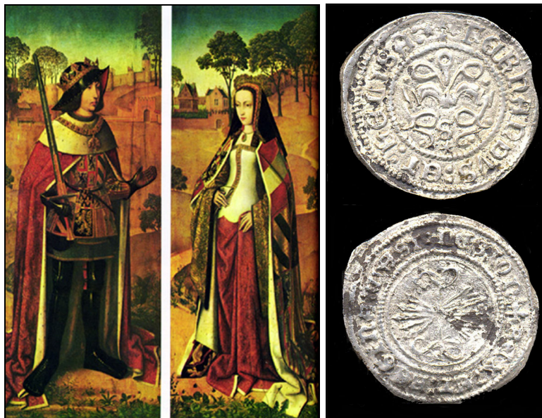
Figura 2: Felipe El Hermoso y Juana La Loca. Philip the Fair and Joan the Mad of Castile in the gardens of the castle of Brussels (Wings of the triptych known as of the town hall of Zierikzee). Moneda de la época, Cuarto de Real acuñado en la ceca de Sevilla entre 1497-1566, se siguió emitiendo bajo el reinado de Carlos I, medía 15 mm y leyenda: REX ET REGINA CAST LEGION, alrededor de un círculo de puntos que contiene las Flechas.