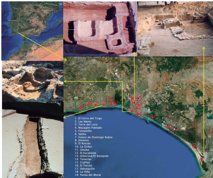
Figura 1. Situación de las instalaciones romanas del litoral onubense, con detalles fotográficos de las tratadas en el texto.

en las costas onubenses, generando un entramado económico similar al del resto del Golfo de Cádiz. Con todo, hasta el momento se cuenta casi con una veintena de asentamientos a lo largo del litoral onubense, extendidos desde la desembocadura del Guadalquivir (El Cerro del Trigo, Almonte) hasta la del Guadiana (Punta del Moral, Ayamonte), conocidos la mayoría de ellos –excepto los tres anteriormente aludidos y excavados: Eucaliptal, Terrón/La Bella y El Cerro del Trigo, además de los excavados y vinculados a Onoba –, a través de prospecciones de superficie 7 ,