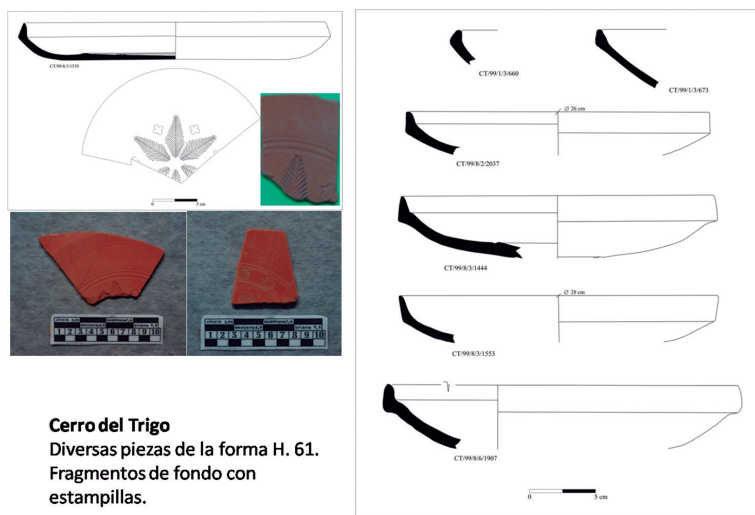
Cerro del Trigo Diversas piezas de la forma H. 61. Fragmentos de fondo con estampillas.