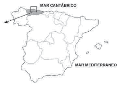
Fig. 1.- Localización geográfica de la zona de estudio.