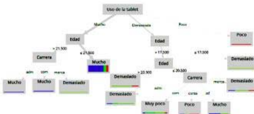
Figura 10. Modelo predictivo 4 sobre el uso de la tablet en el salón de clases.

La Figura 10 muestra el modelo predictivo 4. Por ejemplo, si el estudiante considera que el uso de la tablet en el salón de clases es mucho durante la realización de las actividades escolares, tiene una edad mayor a 21.5 años y estudia la carrera de Comercio entonces este dispositivo móvil se utiliza mucho para la participación activa del estudiante.