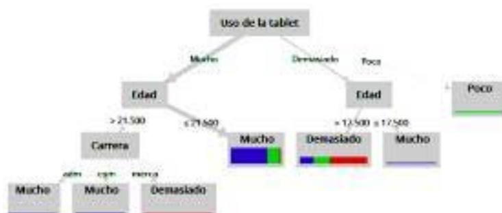
Figura 6. Modelo predictivo 2 sobre el uso de la tablet en el salón de clases.

La Figura 6 muestra el modelo predictivo 2. Por ejemplo, si el estudiante considera que el uso de la tablet en el salón de clases es mucho durante la realización de las actividades escolares y tiene una edad menor a 21.5 años entonces este dispositivo móvil se utiliza mucho para el acceso a las aplicaciones web.