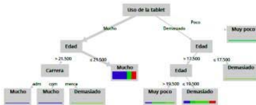
Figura 8. Modelo predictivo 3 sobre el uso de la tablet en el salón de clases.

La Figura 8 muestra el modelo predictivo 3. Por ejemplo, si el estudiante considera que el uso de la tablet en el salón de clases es mucho durante la realización de las actividades escolares, tiene una edad mayor a 21.5 años y estudia la carrera de Administración entonces este dispositivo móvil se utiliza mucho para la difusión de la información en la red.