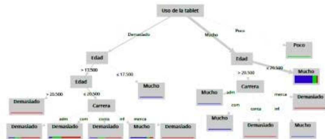
Figura 4. Modelo predictivo 1 sobre el uso de la tablet en el salón de clases.

La Figura 4 muestra el modelo predictivo 1. Por ejemplo, si el estudiante considera que el uso de la tablet en el salón de clases es demasiado durante la realización de las actividades escolares y tiene una edad menor e igual a 17.5 años entonces este dispositivo móvil se utiliza mucho para la búsqueda de la información en Internet.