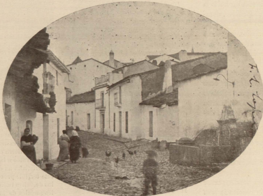
Una calle de Zufre

"Un especial amor de benevolencia hacia los católicos de Alemania, que, sometidos a esta Sede Apostólica, con fe y obediencia suma, luchan, generosos y fuertes, por la causa de la Iglesia, nos impulsa, venerables hermanos, a poner toda nuestra atención y solicitud en dirimir la controversia entre ellos suscitada sobre Asociaciones de obreros, controversia de que muchas veces, en estos últimos años, nos informaron los más de entre nosotros, y al mismo tiempo varo-