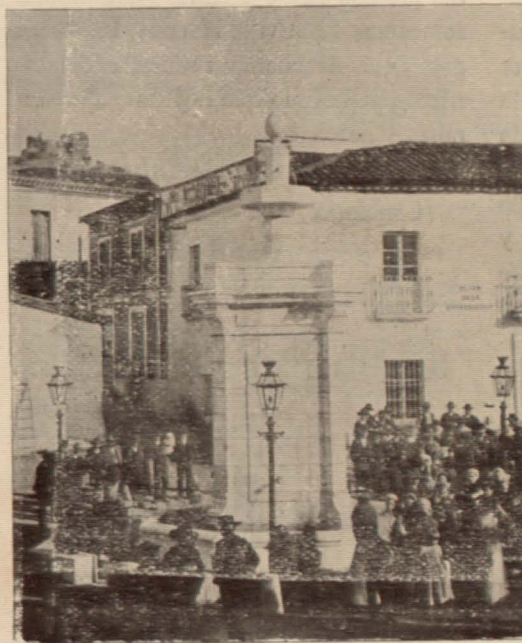
La Fuente de Cortegana

algo, los esfuerzos incesantes de las asociaciones benéficas y religiosas, limitadas a estrecha esfera y a escasos medios, y si se cumplieran las leyes y disposiciones protectoras del Gobierno, sabiamente orientadas aunque de eficacia escasa, por no compenetrarse con la realidad viviente: pero precisa más, muchísimo más, que los capitalistas, los propietarios, los intelectuales, todos los hombres de buen deseo y de buena fe, apercebidos del peligro social motivado por la acumulación