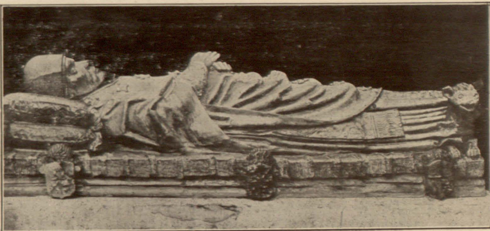
ARACENA.—Estatua yacente del Prior Pero Vázquez hecha en barro vidriado y reconocida como obra de un extraordinario valor, que se conserva en el Castillo

la vegetación concertadamente dirigida. Los correctivos se dividen en abonos y enmiendas; la enmienda designa las materias empleadas para modificar el estado de las sustancias que encierra la tierra laborable y trasmutarla en una forma nueva, bajo la cual su asimilación por las plantas sea más fácil; mientras que el nombre de abono comprende a las materias que sirven directamente para la nutrición de las plantas.