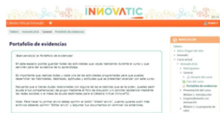
Figura 6. Portafolio de evidencias.

Asimismo, cuenta con el portafolio de evidencias, espacio donde se suben todos los archivos solicitados en las Evidencias de aprendizaje de cada Módulo (Figura 6).