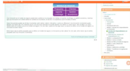
Figura 7. Índice de módulos.