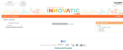
Figura 3. Bloque de mensajes. Fuente: (Innovatic, 2016).

Glosario. Presenta las definiciones de los términos más importantes relacionados con las diferentes temáticas del curso. (Ver Figura 4)