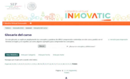
Figura 4. Glosario.

Glosario. Presenta las definiciones de los términos más importantes relacionados con las diferentes temáticas del curso. (Ver Figura 4)