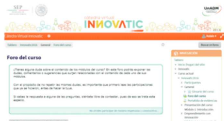
Figura 5. Foro del curso.

El Foro del curso permite la constante comunicación de los participantes para exponer dudas o comentarios. (Ver Figura 5)