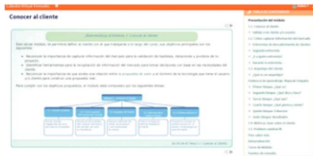
Figura 8. Estructura pedagógica de temas.