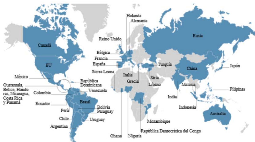
Figura 1. Países con presencia del Cartel de Sinaloa (54).

Como reveló el juicio del Chapo, el Cartel de Sinaloa es responsable de haber exportado ilegalmente 154 toneladas de cocaína, así como volúmenes aún superiores de otros estupefacientes, realizando operaciones estimadas en 14 mil millones de USD (Duclos, 2018). En 2016, esta organización funcionaba como una multinacional, con operaciones en 54 países a nivel mundial (Figura 1), a través de alianzas con otras organizaciones criminales, el usufructo de sus rutas, y la contratación de traficantes de armas conocidos como “facilitadores sombra”, con los que negociaba por intermedio de sus socios en las FARC (Gómora, 2016).