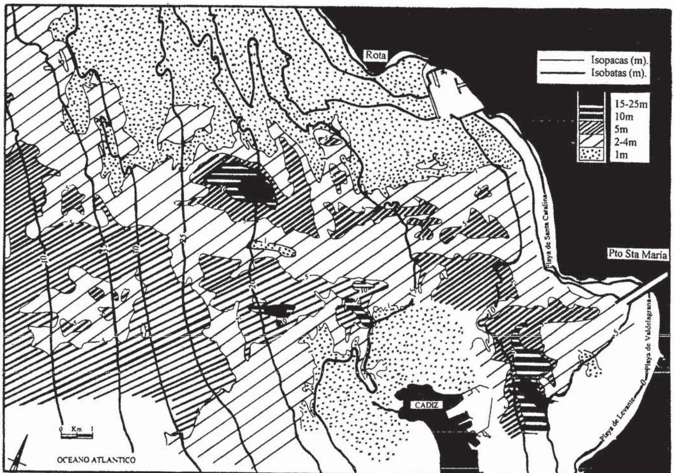
Figura 4.- Mapa de distribución de espesores del relleno sedimentario reciente en los fondos de la bahía de Cádiz.