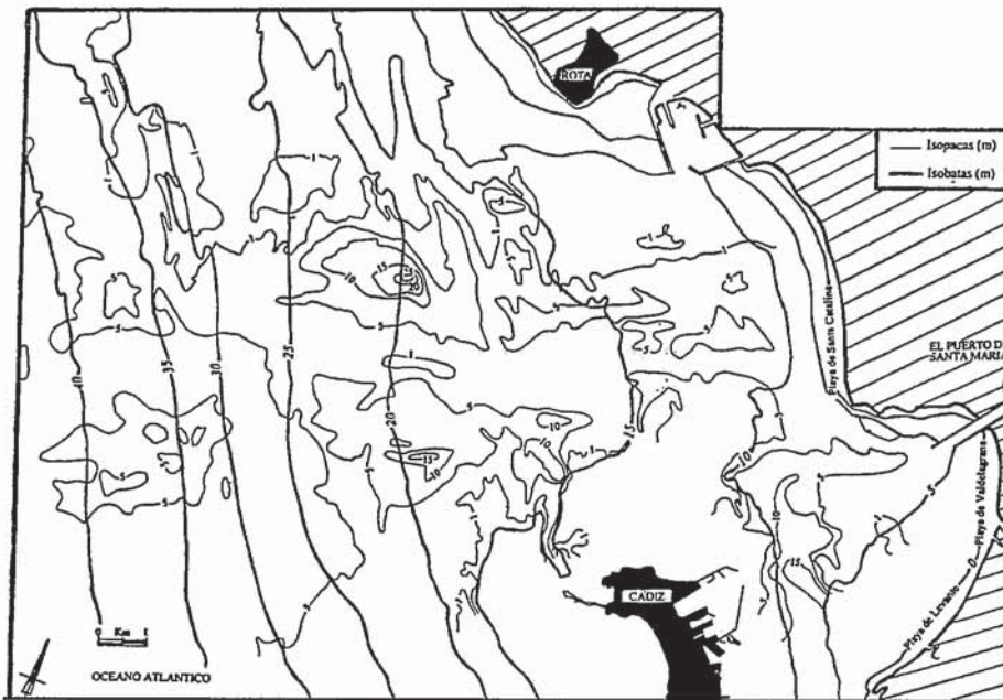
Figura 2.- Mapa de isopacas de los sedimentos recientes no consolidados de la bahía de Cádiz y plataforma continental adyacente.

El análisis de la orientación y distribución espacial de espesores de acumulaciones sedimentarias (Fig.4), muestra que los espesores entre 0 y 1 m, aparecen en zonas someras cercanas a la costa, mientras que los mayores espesores se encuentran en las zonas centrales más profundas.