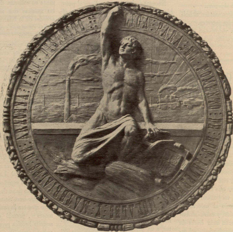
Alegoría del resurgimiento serrano

persiguen, deja de verificarse, tal vez, porque en lugar de ser directores, son dirigidos por el pueblo inconsciente. No de otro modo se explica la repetición de actos tan significativos como el de glorificar a la torería — ese vicio nacional que nos degrada — por encima de todas las desdichas o victorias alcanzadas por nuestro Ejército. La rendición de Cavite o la muerte del Mizzán, ¿qué valen an-