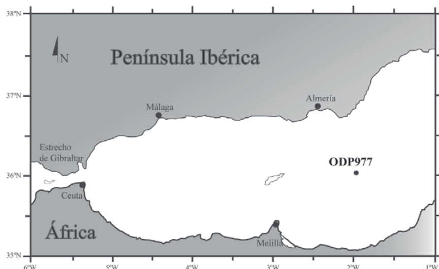
Fig. 1.- Situación del sondeo ODP977 (36° 01.907'N, 1° 57.319'W) recogido en el mar de Alborán, Mediterráneo occidental.

Fig. 1.- Location of ODP site 977 (36° 01.907'N, 1° 57.319'W) in the Alboran Sea, Southern Spain, Western Mediterranean.