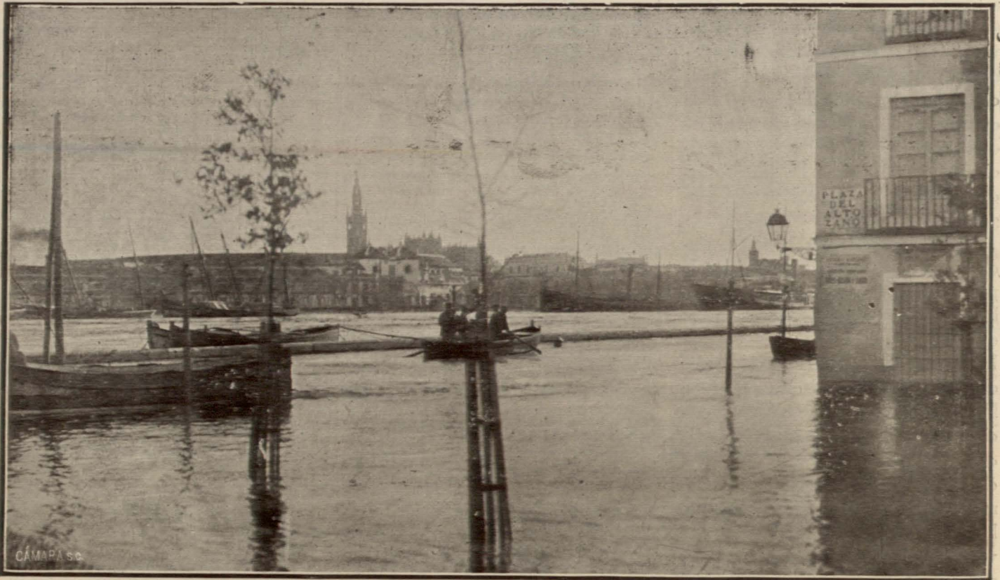
LA INUNDACIÓN DE SEVILLA.—Aspecto desde la Plaza del Altozano.