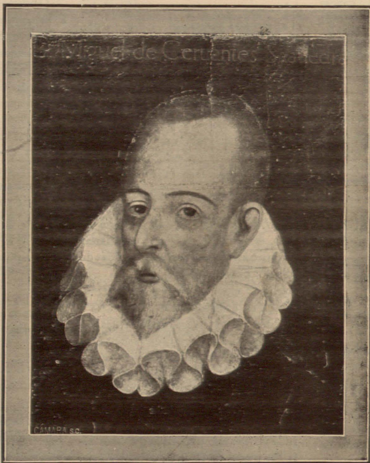
Miguel de Cervantes Saavedra el inmortal autor de Don Quijote de la Mancha . Retrato pintado por Jáuregui y que según las investigaciones recientes de Don Alejandro Pidal, es el auténtico del glorioso Manco de Lepanto .

empresas sin tener en cuenta los obstáculos que ofrecen de una parte, como en lo referente á sindicatos y caminos vecinales, la pública administración con su eterno expedienteo y su falta de recursos; y de otra, como en la relativo á ferrocarriles é industrias, la carencia de recursos locales y la falta de capital que en la cuantía correspondiente á la grandeza del proyecto, se arriesgue en em-