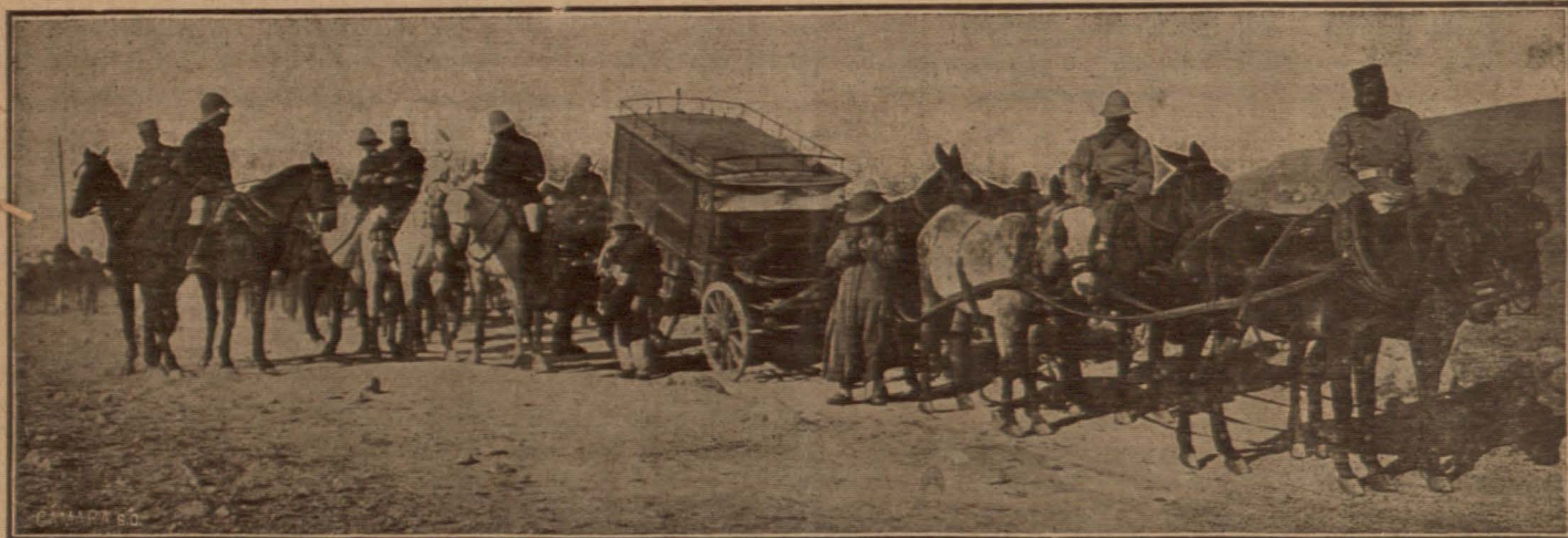
DE LA CAMPAÑA.—Un carro de la Sanidad Militar, conduciendo heridos, atascado en el camino del Avanzamiento.

Basta la voluntad de un par de hombres para llevar á cabo una obra de transcendencia inmensa: estos hombres recabarán, en nombre de la Junta que los comisione, de los señores sacerdotes, médicos, abogados, profesores, etcétera,