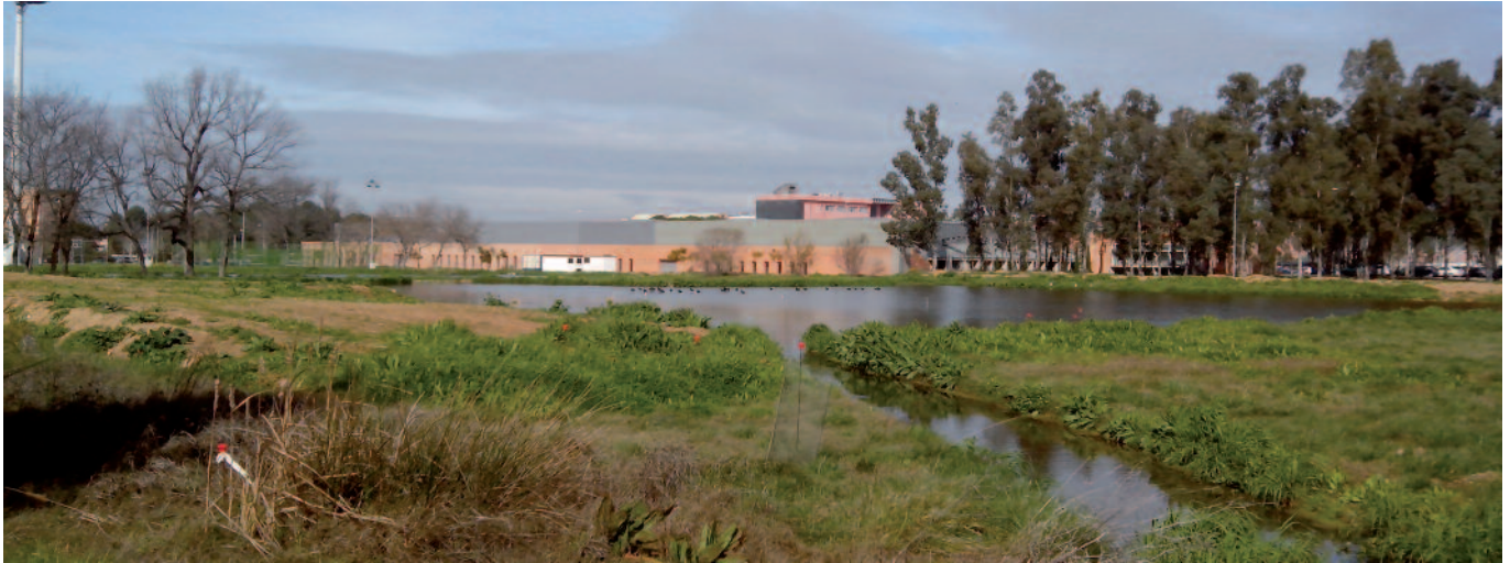
Fig. 4.- Laguna alta y canal de entrada. Al fondo se observa una colonia de moritos ( Plegadis falcinellus ) (febrero de 2014).

Fig. 4.- Upper lake and water input. At the end a colony of glossy ibis ( Plegadis falcinellus ) can observed (February, 2014).