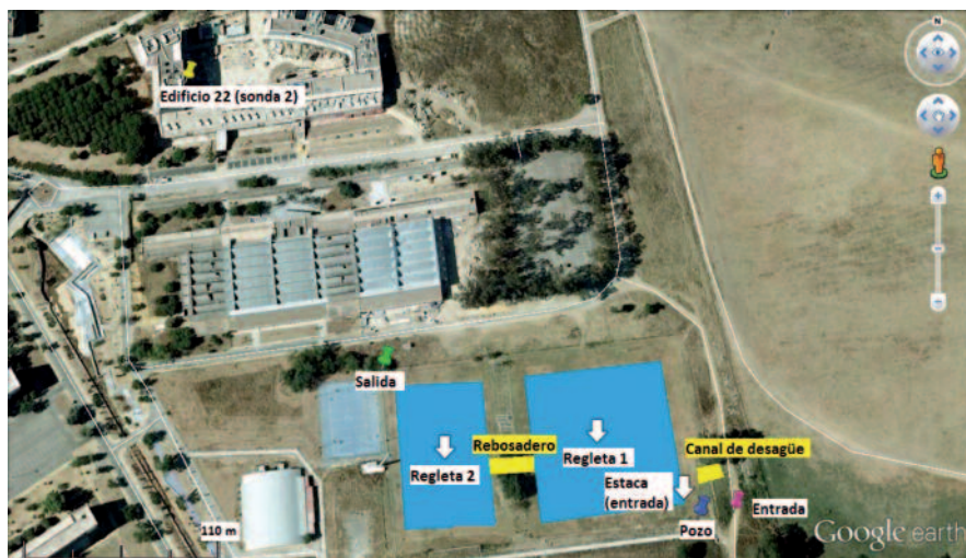
Fig. 1.- Localización de las estructuras instaladas y de los puntos de muestreo en el sistema lagunar ( 37^{\circ}21'23.63''N , 5^{\circ}56'5.08''O ).

Como mayor parte del trabajo de gabinete se ha realizado una recopilación e