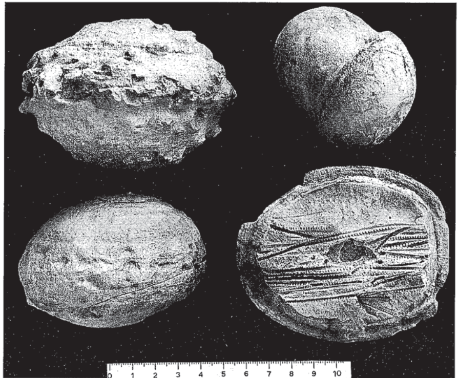
Fig. 3.- Detalles de la morfología externa de algunos nódulos de El Pobo, mostrando laminación paralela y erosión diferencial de la misma. El nódulo del ángulo inferior derecho muestra una acumulación de moldes de monograptidos en su plano ecuatorial, y el de la esquina opuesta proyecciones redondeadas debidas a conchas de cefalópodos.

Los nódulos silúricos (en mayor medida que otros nódulos ordovícicos y devónicos) tampoco han pasado desapercibidos a la sabiduría popular, en buena parte de las regiones que acabamos de mencionar. Así, en la Rama Castellana de la Cordillera Ibérica se les designa indistintamente con el nombre de «cabezas de moro» o «cabezas de moro», hecho ya señalado por Calvo (1895), y que forma parte de una tradición arraigada cuyo origen desconocemos. En otras partes de España, eruditos locales, coleccionistas y terratenientes atesoran nódulos en la creencia de que corresponden a verdaderos fósiles, o bien encierran suerte y riquezas en su interior, que por ello debe ser preservado intacto. El caso más frecuente en algunas zonas de Sierra Morena es que se recolecten para su utilización en juegos infantiles, haciéndoles rodar pendiente abajo a ver cuál de ellos logra mayor alcance... En Vilches (Jaén) creen que son tortugas fosilizadas, dado que allí predominan los nódulos elipsoidales de gran tamaño que acusan fuerte compactación. Pero sin duda la narración más extraordinaria al respecto se encuentra en el tercer capítulo de la obra de García Sánchez (1983) titulado con justificada razón «Ab Ovo: Desde el Huevo», refiriéndose a sucesos