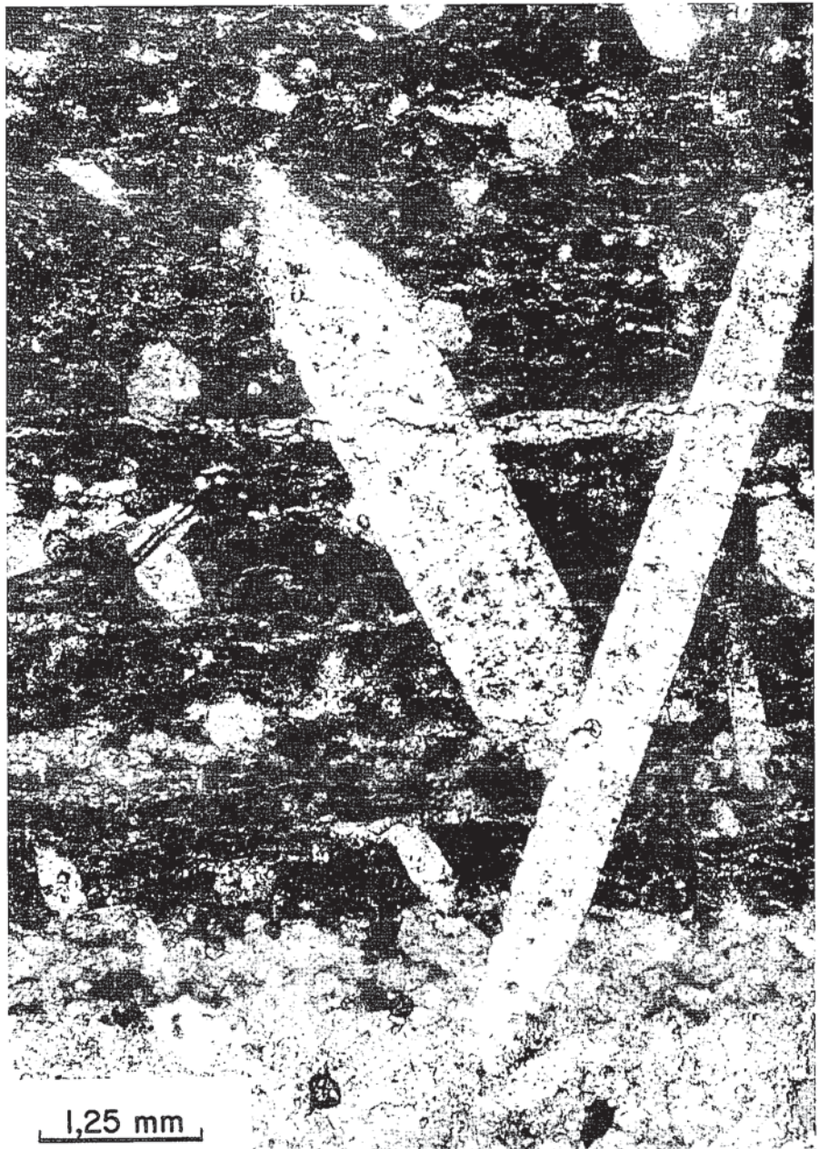
Fig. 3.-Porfiroblastos de escapolita sobreimpuestos a la fábrica planar, definida por la matriz carbonatada del mármol, que sugieren una blastesis metamórfica en condiciones estáticas.

A pesar de sus reducidas dimensiones, el hallazgo de mármoles con metamorfismo de alta temperatura y baja presión en el flanco sur del Sinclinorio de Vizcaya, tiene importantes implicaciones geodinámicas, ya que proporciona un criterio significativo para situar correctamente el trazado de la FNP en la Cuenca Vasco-Cantábrica. Dicho accidente debe situarse hacia el Sur de los afloramientos con mármoles, lo que implica un desplazamiento mínimo de 20 km al Sur con respecto a los trazados propuestos previamente. Esta nueva posición de la FNP concuerda con datos geológicos de índole regional, como los discutidos por Curnelle (1990), en los que se indica que el vulcanismo alcalino intracretácico queda localizado al Norte de la FNP, hecho que con las propuestas de trazado anterior no se producía en la Cuenca Vasco-Cantábrica. En función de nuestros datos, las fallas de Régil y de Legorreta-Aulestia (Fig. 1A), consideradas hasta ahora como la continuación de la falla de Leitza (E.V.E. e I.T.G.E., 1991), serían equivalentes a las fallas reco-