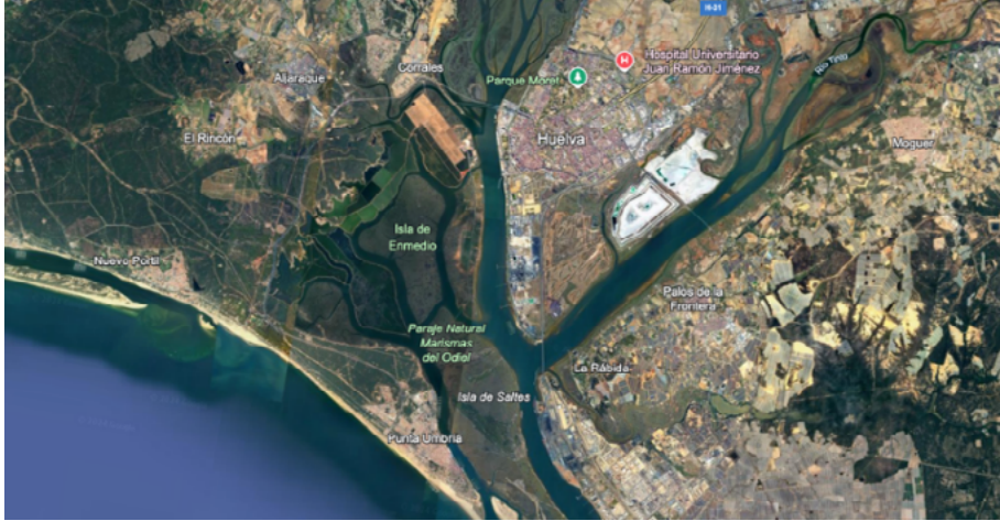
Figura 1. Imagen aérea bidimensional de la zona de Marismas del Odiel.