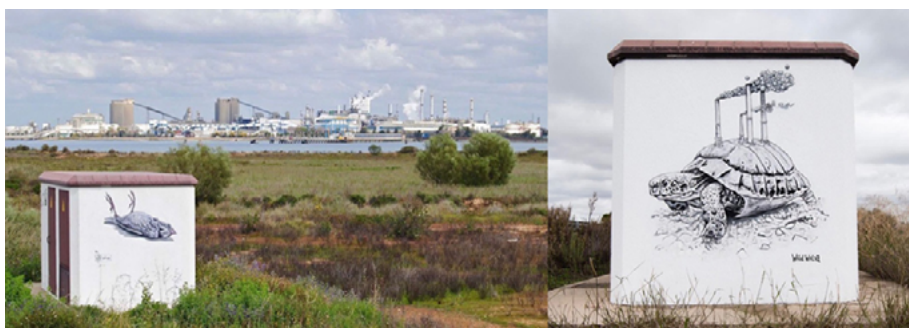
Figura 5 y 6. Imágenes de la obra «Marisma limpia» de Wild Welva en las Marismas del Odiel frente a las fábricas.

del Paraje Natural Marismas del Odiel y muestra las consecuencias de la contaminación en el entorno para las especies que en él habitan (figuras 5 y 6). Estas obras, por su simbolismo y finalidad, se configuran como el punto de partida para el tratamiento de este patrimonio controversial en la etapa de Educación Infantil en la situación de aprendizaje presentada en este capítulo.