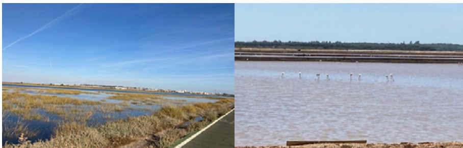
Figuras 2 y 3. Imágenes de Marismas del Odiel.

Desde el punto de vista natural, nos hallamos ante un paraje que alberga ecosistemas de playa, marismas, laguna salada, pinar y arenales de interior, lo que hace que su vegetación y fauna sea también diversa (López-Pérez, 2014). La composición de sus aguas es rica en nutrientes, por lo que es fuente de alimentación para las aves tanto migratorias como las que se crían y permanecen en este territorio (figuras 2 y 3).