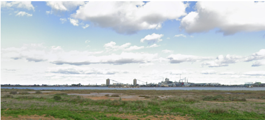
Figura 4. Imagen de las Marismas del Odiel con el polo químico al fondo.

Sin embargo, este paisaje se ve visual y ecológicamente entorpecido con la llegada del polo químico a la ciudad de Huelva en la época del desarrollismo en los años sesenta del siglo xx (figura 4). Este hecho convierte a este elemento del patrimonio natural onubense en un patrimonio interesado, según la clasificación de perspectivas desde las cuales se pueden analizar los patrimonios controversiales (Arroyo et al. , 2022; Estepa et al. , 2021; Sampedro-Martín et al. , 2023). Con el estudio del Paraje Natural Marismas del Odiel y las controversias que subyacen a su gestión y protección por parte de las administraciones y la ciudadanía, se puede analizar el conflicto de intereses que se dan entre la lógica ecológica de preservación de las especies de la flora y fauna de este entorno patrimonial y la actividad económica del ser humano que, en el caso concreto del polo químico onubense, es, a su vez, imprescindible para la subsistencia y un riesgo para la supervivencia por la contaminación. La toxicidad expulsada al aire y la eliminación de los residuos a través del agua convierten a Huelva en una ciudad con un alto nivel de contaminación por suelo, agua y aire. Los Objetivos de Desarrollo Sostenible (ODS) de la Agenda 2030, promovidos por la Organización de las Naciones Unidas (ONU) en 2015, contemplan en sus objetivos 6, 7, 13, 14 y 15 acciones que tratan de erradicar este tipo de acciones contaminantes y peligrosas para la salud que se dan en la ciudad de Huelva.