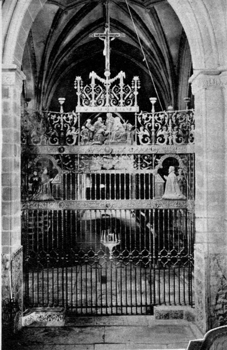
CARA POSTERIOR DE LA VERJA DEL PRESBITERIO. HERMOSA OBRA DE FORJA, REPUJADO, INCRUSTACIÓN Y POLICROMADO, LABRADA EN TOLEDO POR JULIO PASCUAL

Maumejean, de Madrid, como las mejores piezas salidas de sus talleres.