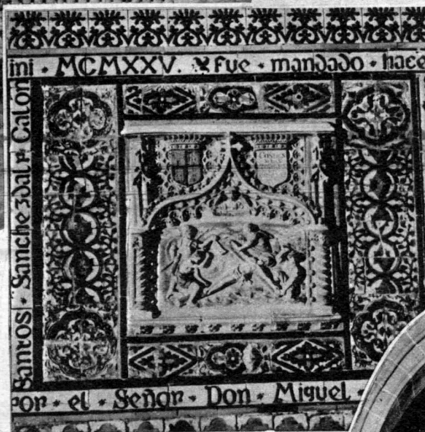
FRAGMENTO DEL MAGNÍFICO ALICATADO DE AZULEJOS ANTIGUOS, RECONSTRUÍDO, Y UNA DE LAS ESTACIONES DEL "VIA CRUCIS" EN RELIEVE

luntad y el esfuerzo inteligente, campo experimental de las más audaces innovaciones y escuela que ha prodigado muchas enseñanzas—, posee el gusto noble de las artes y de cultura en general, unido al culto de la historia patria.