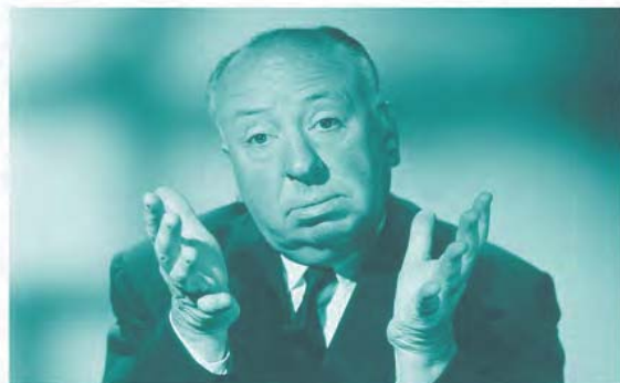
ALFRED HITCHCOCK. DIRECTOR DE CINE BRITÁNICO (1899-1980)

«IMAGÍNESE A UN HOMBRE SENTADO EN EL SOFÁ FAVORITO DE SU CASA. DEBAJO TIENE UNA BOMBA A PUNTO DE ESTALLAR. ÉL LO IGNORA. PERO EL PÚBLICO LO SABE. ESTO ES EL SUSPENSE»