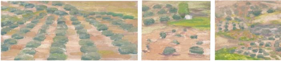
Fig. 6 Modelos de olivares semiintensivos, integrados en ruedos y olivar de montaña. Temple de huevo sobre tabla. 51 x 25 cm, 25 x 25 cm y 25 x 25 cm

la dehesa de acebuches, los acebuchales de montaña y los acebuches aislados y monumentales representado por las características herrizas de nuestros campos.