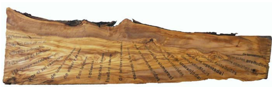
Fig. 12 Anima olea (Antonio Machado), 2019. Transferencia sobre madera de olivo viejo. 20 x 84 x 3 cm

El campo andaluz, peinado por el sol canicular, de loma en loma rayado de olivar y de olivar! Son las tierras soleadas, anchas lomas, lueños sierras de olivares recamadas. Mil senderos. Con sus machos, abrumados de capachos, van gañanes y arrieros. ¡De la venta del camino a la puerta, soplan vino trabucaires bandoleros!