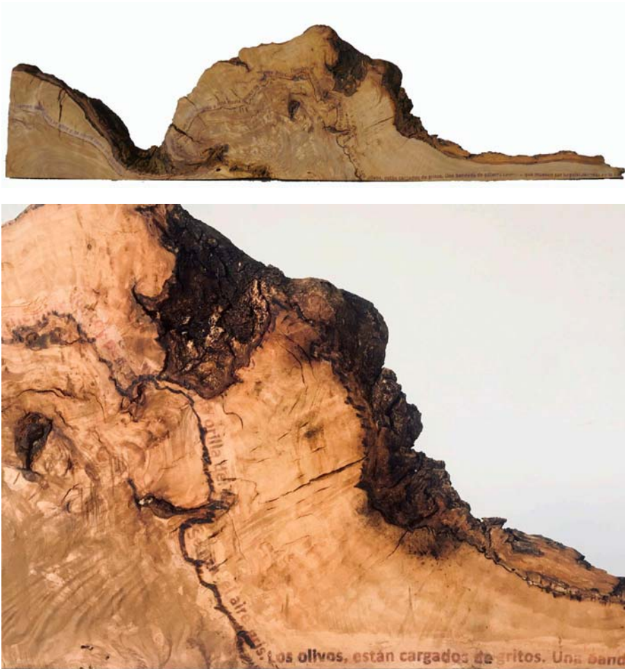
Fig. 11 Anima olea (García Lorca), 2019. Pieza y detalle. Transferencia sobre madera de olivo viejo. 26 x 101 x 10 cm

El campo de olivos se abre y se cierra como un abanico. Sobre el olivar hay un cielo hundido y una lluvia oscura de luceros fríos.