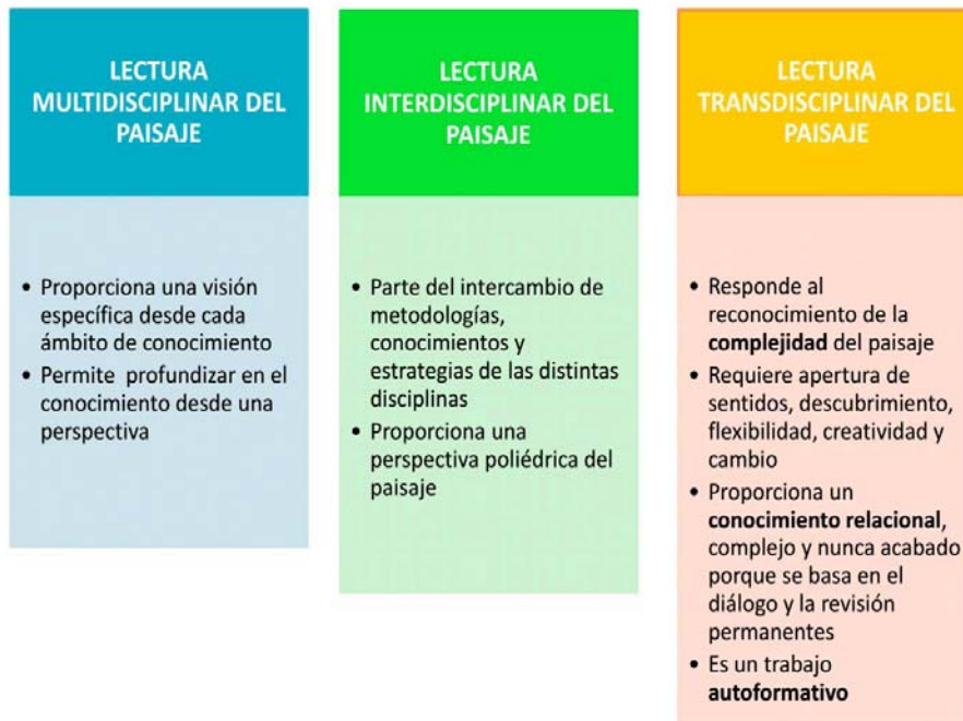
Fig. 1. Esquema comparativo del abordaje multidisciplinar, interdisciplinar y transdisciplinar. Elaboración propia

Para el trabajo transdisciplinar, en una primera fase, hemos partido del análisis del proceso histórico de expansión del olivar en Andalucía y su distribución geográfica (Guzman, 2005; Infante-Amate, 2014; Gómez Calero, 2009; Sánchez Ruiz, 2018) lo que nos ha permitido iniciar nuestra interpretación considerando las claves geohistóricas del olivar andaluz y sus diferentes morfologías, relacionándolas con sus manejos y sistemas de explotación que han ido cambiando a lo largo de la historia al ritmo de las transformaciones tecnológicas.