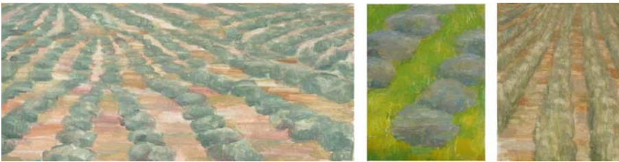
Fig. 7 Modelo de olivar intensivo, ecológico y en espaldera. Temple de huevo sobre tabla. 75 x40 cm 25 x 40 cm y 25 x 40 cm

En una tercera línea (fig. 6) se presenta la diversificación y domesticación del acebuche en nuestros olivares más genuinos con tres piezas que simbolizan el olivar poco capitalizado y con un marcado carácter multifuncional con un aprovechamiento más próximo a manejos agroforestales, los pequeños olivares integrados en los ruedos y los olivares propios de cultivo intensivo y ordenado en hileras.