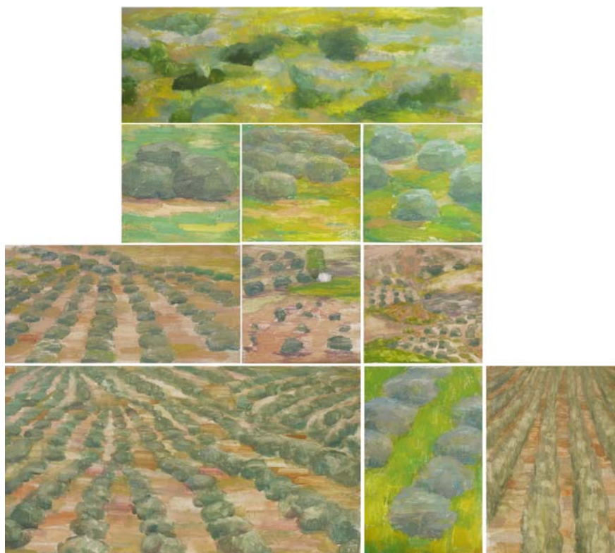
Fig. 8 Diversitas olea , 2019.

Temple de huevo sobre tabla. 118 x 132 cm dimensión global (separación calles 1 cm)