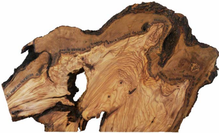
Fig. 14 Anima olea (José María Lopera), 2019. Transferencia sobre madera de olivo viejo. 36 x 52 x 4 cm

Yo nací en las raíces del olivo, ascendí por la savia de su tronco, me hice hombre de trama en su ramaje, y me ungué con su bálsamo purísimo hasta quedar lucerna en luz de alma.