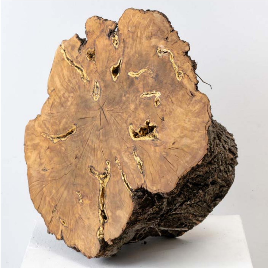
Fig. 17 Kintsugi , 2019.

Pan de oro sobre tronco de olivo viejo. 31 x 47,5 x 40 cm