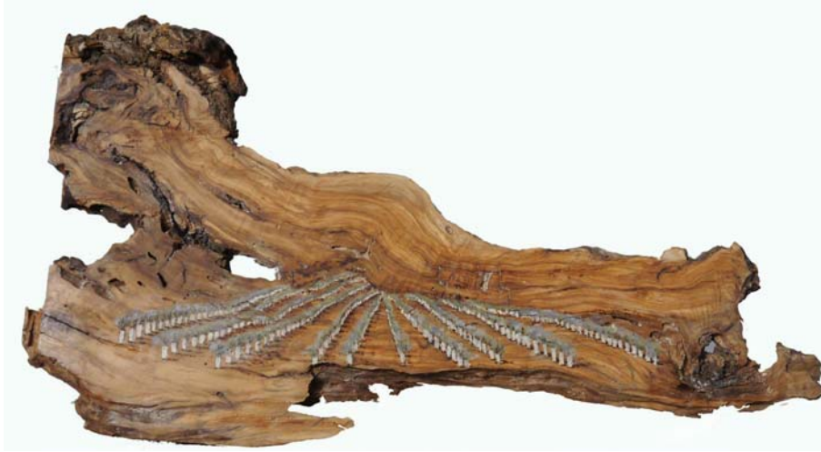
Fig. 16 Mutatio , 2019.

Acrílico sobre madera de olivo viejo. 25,5 x 101 x 7,5 cm