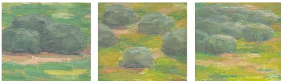
Fig. 5 Modelos de acebuches: en herrizas, dehesas y dispersos. Temple de huevo sobre tabla. 25 x 25 cm c/u

Es característica de las partes costeras de la vegetación mediterránea la maquia o comunidad preforestal, vestigio del antiguo bosque, donde dominan especies como el acebuche, el algarrobo, la encina, las pistacias, etc. (González Bernáldez, 1992: 136)