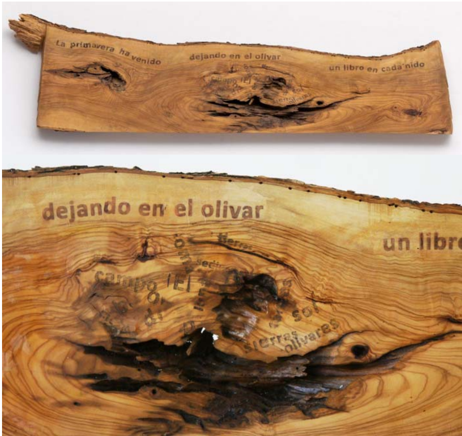
Fig. 10 Anima olea (Rafael Alberti), 2019. Pieza y detalle. Transferencia sobre madera de olivo viejo. 22 x 71 x 3 cm

La primavera ha venido dejando en el olivar un libro en cada nido. (Rafael Alberti)