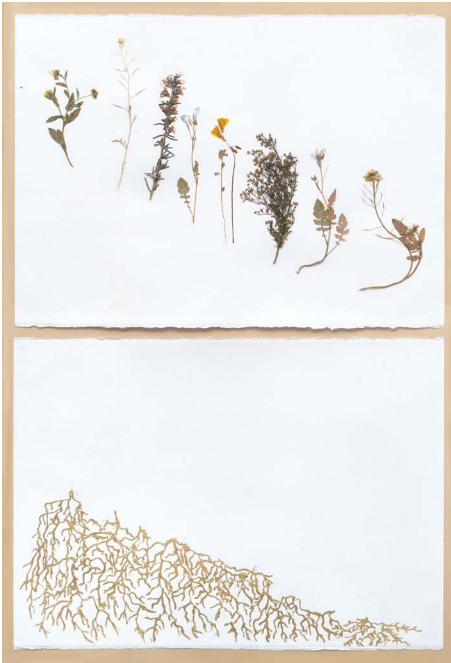
Fig. 19 Las malas hierbas / Viriditas bonis , 2019. Flores secas y pan de oro. 2 piezas de 50 × 70 cm c/u.