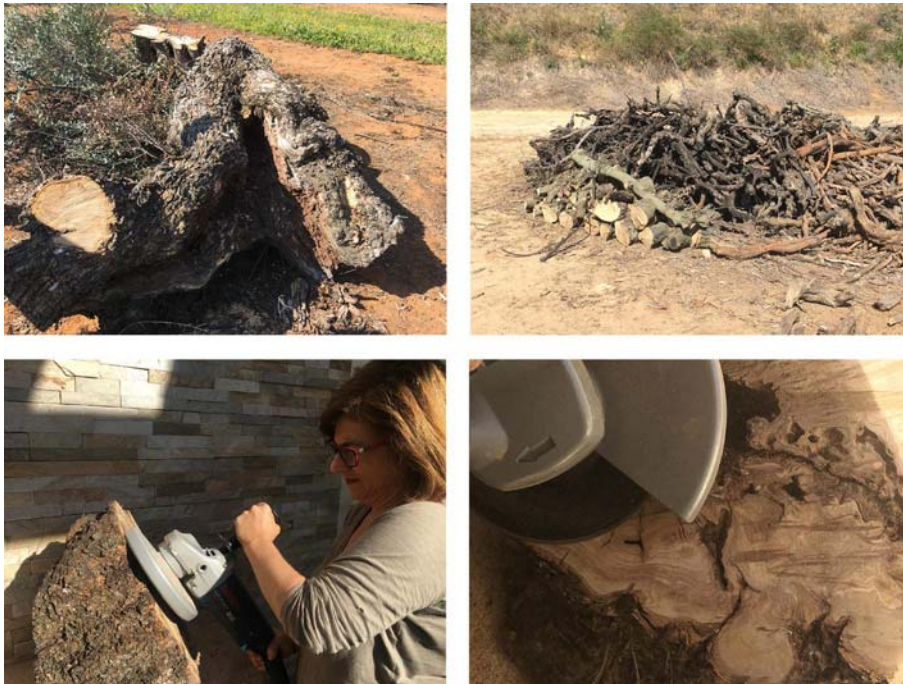
Fig.9 Proceso de selección, lijado y tratamiento de los troncos de olivo para la elaboración de las piezas.

Caminar por los olivares andaluces evoca sin dificultad algunos de los poemas que todos hemos recitado de niños: campo, campo, campo, entre los olivos, los cortijos blancos . Se han tomado prestado algunos de los versos más significativos de nuestra literatura que hacen referencia al olivo y a sus paisajes y se han transferido siguiendo los ritmos de las vetas que en muchas ocasiones sugieren paisajes. Cada pieza invita a detenerse, leer la veta de la madera, encontrar signos de la vida del árbol, rastrear el curso de la historia silenciosa del olivo viejo, identificarnos con su poesía, recuperar la memoria de la tierra, descubrir cicatrices, imaginar las heridas.