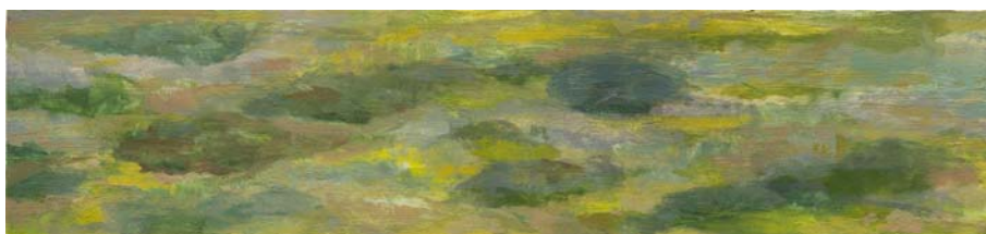
Fig. 4 Matorral mediterráneo. Temple de huevo sobre tabla. 75 x 25 cm

La obra parte del matorral mediterráneo, diverso y rastroso, donde destacan las manchas oscuras del acebuche matorralizado que emerge en diversos puntos (fig. 4).