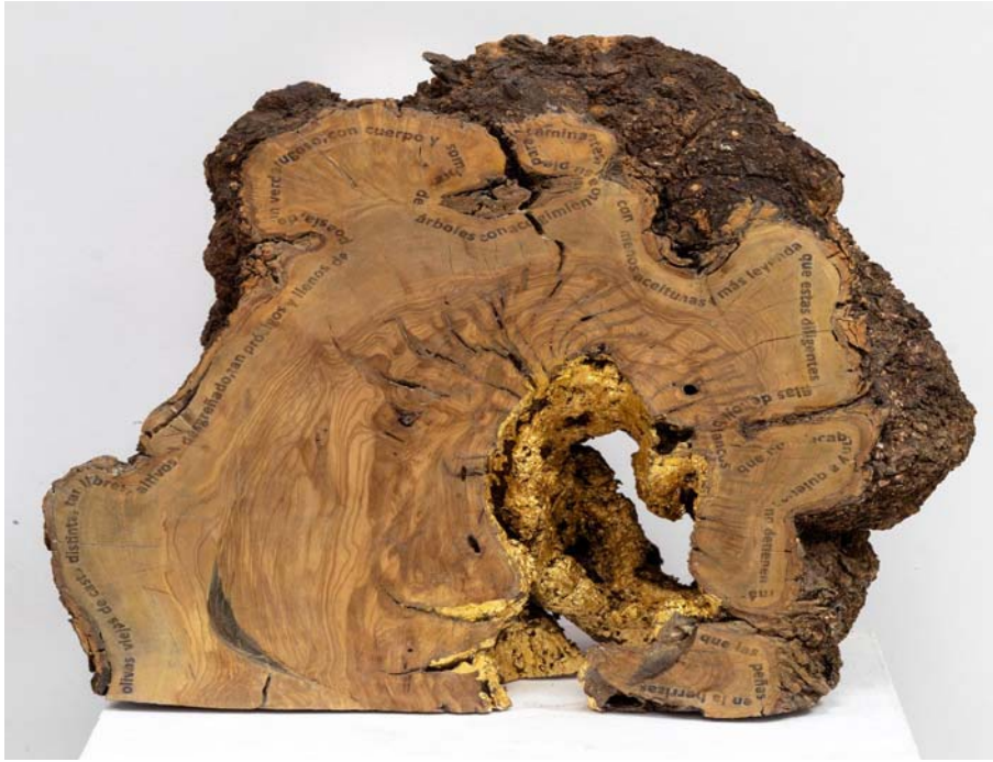
Fig. 18 Kintsugi , 2019.

Pan de oro sobre tronco de olivo viejo. 46 x 45 x 27,5 cm