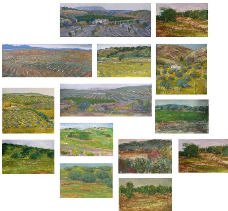
Fig. 2 Aproximación interdisciplinaria al olivar andaluz , 2019. Apuntes de temple de huevo sobre papel. Medidas variables

La serie de estudios ha sido realizada IN SITU, en distintos enclaves del olivar andaluz buscando una caracterización tipológica de sus paisajes. El trabajo de campo es la base de estos estudios y apuntes porque la percepción plurisensorial en el territorio es indispensable para la comprensión del olivar en su complejidad. La búsqueda abierta por los campos de la geografía andaluza, la inmersión en el territorio, la percepción atenta, constituyen el principio clave de estos trabajos. Sentir el calor del campo, escuchar el sonido de la chicharra y el vuelo del zorzal, oler la tierra y el sabor amargo de la aceituna constituyen estrategias básicas para la aproximación desinteresada y abierta del pintor al paisaje del olivar en un proceso