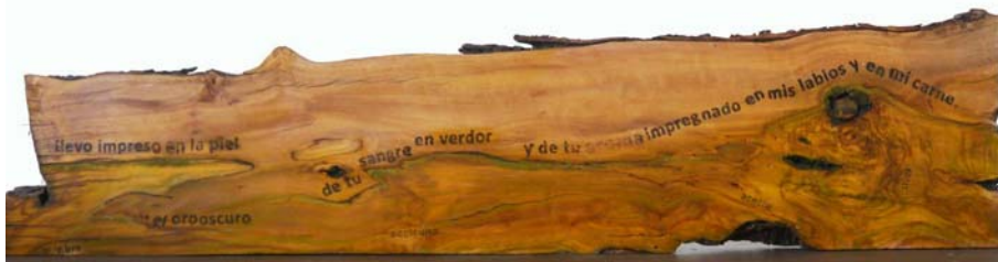
Fig. 15 Anima olea (José María Lopera), 2019. Transferencia sobre madera de olivo viejo. 22 x 71 x 3 cm