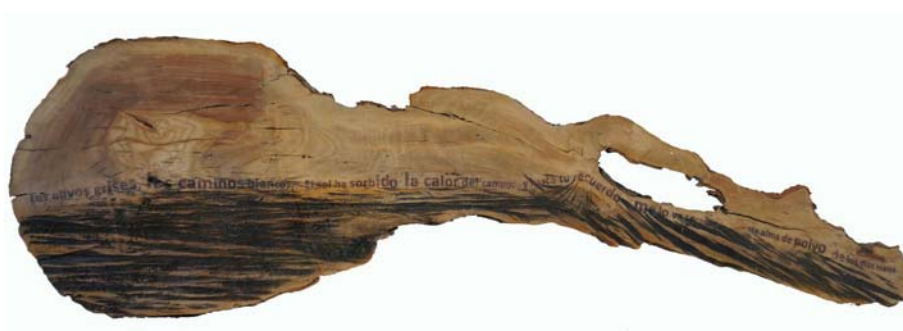
Fig. 13 Anima olea (Antonio Machado), 2019. Transferencia sobre madera de olivo viejo. 20 x 84 x 3 cm

Los olivos grises, los caminos blancos. El sol ha sorbido la calor del campo; y hasta tu recuerdo me lo va secando este alma de polvo de los días malos.