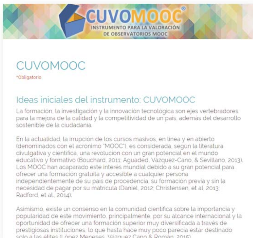
Figura 1. Cuestionario de Inicial para recabar información del CUVOMOOC®.

Asimismo, Barbero-García (2007), indica que es una escala de medida de actitud, además agrega la autora que "actitud" según Likert significa disposición hacia la acción manifiesta, se mide de manera indirecta a partir de las declaraciones de opinión. El enlace del cuestionario correspondiente al segundo estudio Delphi es http://bit.ly/2oQjaJe (Figura 1).