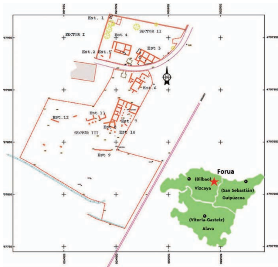
Fig. 1.- Localización del yacimiento de Forua (Martínez Salcedo, 2014). Ver figura en color en la Web. Fig. 1.- Forua site location (Martínez Salcedo, 2014). See colour figure on the Web.

pacto con algunos poros de pequeño tamaño y a favor de fracturas se desarrollan procesos de oxidación que dan lugar a materiales terrosos de color ocre. Estos materiales no muestran signos de magnetismo. Las muestras del grupo 2 se caracterizan por presentar una superficie rica en vesículas esféricas con un tamaño que varía entre 1 y 3 mm (Fig. 2B). En corte fresco se observa una gran heterogeneidad con zonas claras formada por silicatos y zonas oscuras de aspecto vítreo y carácter magnético. Las muestras del grupo 3 presentan una superficie de aspecto terroso, de color rojo intenso a ocre (Fig. 2C). En corte fresco muestra una textura homogénea y compacta, y total ausencia de vesículas. Estas escorias son magnéticas.